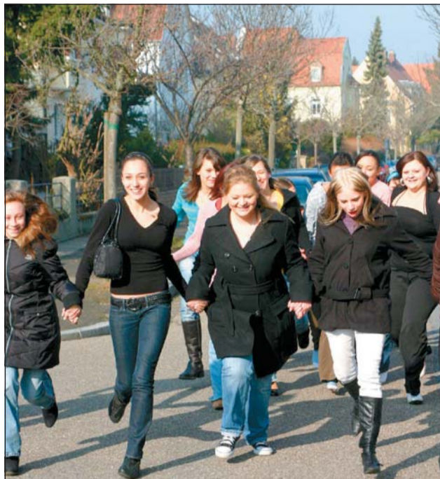
L'amitié franco-allemande est vécue intensément par les lycéens de Bardot et de Landstuhl.

L'Europe, il ne suffit pas d'en parler, il serait temps d'ajouter de nouvelles pierres à l'édifice. Aujourd'hui, les lycéens de Bardot recevront leurs camarades de Landstuhl pour une journée festive et sportive. L'occasion de publier cette page spéciale de reportages, réalisées par les élèves des deux établissements dans le cadre du concours « Les jeunes écrivent l'Europe », organisé par l'OFJA (Office franco-allemand de la jeunesse) et l'ARPEJ (Association régionale presse ensei-