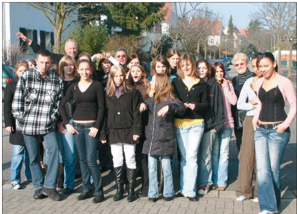
Qui est de Pont-à-Mousson et qui est de Landstuhl ?

De plus, il y a des espaces réservés aux fumeurs sur les quais des gares avec des cendriers mis à disposition afin qu'on ne jette pas les mégots par terre. En outre,