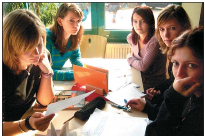
Les élèves ont planché durant plusieurs jours sur les différences et les points communs.

Quels sont les points communs et les différences entre les habitants des deux villes jumelées ? Les élèves ont planché sur les modes de vie. Au-delà des préjugés.