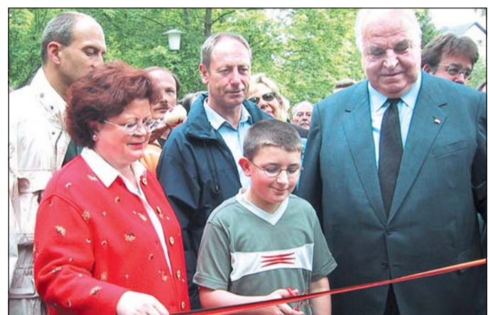
L'ancien chancelier Helmut Kohl pris en photo par les élèves lors de l'inauguration.

Les élèves ont assisté à l'inauguration du chemin franco-allemand, baptisé Helmut-Kohl.